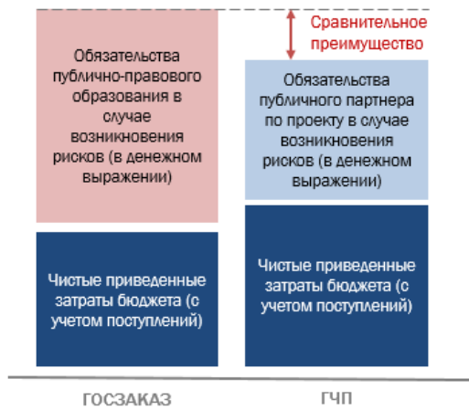
Рисунок 2. Подход к обоснованию сравнительного преимущества проекта ГЧП

передачей и финансированием эксплуатации посредством доведения средств некой государственной структуре) (см. рисунок 2). При этом такое обоснование выбора ГЧП, как способа реализации инфраструктурного проекта, проводится (в целях упрощения процедуры) с рядом допущений: